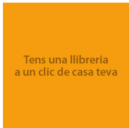
( https://www.libelista.com/ca )