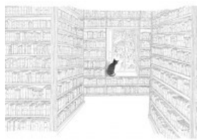
( http://www.nuvol.com/opinio/sector-editorial-voladura-controlada/ )

Cites. Es pot estimar i ser un escèptic? ( http://www.nuvol.com/opinio/cites-es-pot-estimar-i-ser-un-esceptic/ )