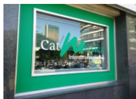
( http://www.nuvol.com/opinio/creieu-que-la-critica-dels-concerts-es-necessaria-o-prescindible/ )

Sector editorial: voladura controlada ( http://www.nuvol.com/opinio/sector-editorial-voladura-controlada/ )