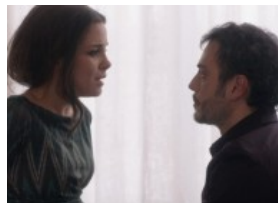
( http://www.nuvol.com/opinio/cites-es-pot-estimar-i-ser-un-esceptic/ )

Deu gestos que ens traeixen ( http://www.nuvol.com/noticies/deu-gestos-que-ens-traeixen/ )