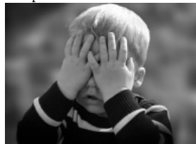
( http://www.nuvol.com/noticies/deu-gestos-que-ens-traeixen/ )

Deu gestos que ens traeixen ( http://www.nuvol.com/noticies/deu-gestos-que-ens-traeixen/ )