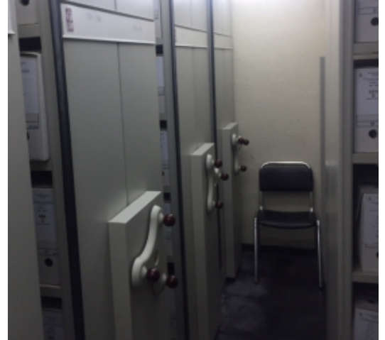
l'Arxiu Municipal de Palafolls

Es tracta d'un local a la mateixa plaça Major, que antigament va ser un restaurant i que ara s'adaptarà per poder acollir la documentació municipal.