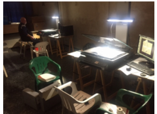
Treballs de digitalització