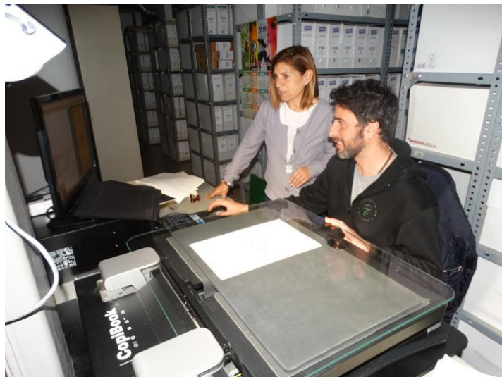
Canyelles digitalitza el seu arxiu històric. Ajuntament de Canyelles

Arxivat a: Arxiu Municipal de Canyelles (/etiqueta/arxiu-municipal-de-canyelles) Xarxa d'Arxius Municipals (/etiqueta/xarxa-darxius-municipals) Canyelles (/municipi/canyelles)