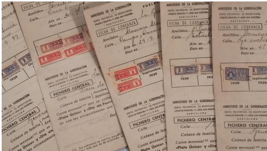
Arxiu Municipal de La Granada del Penedès, 1939. Fitxes del Plato Único i Día sin postre