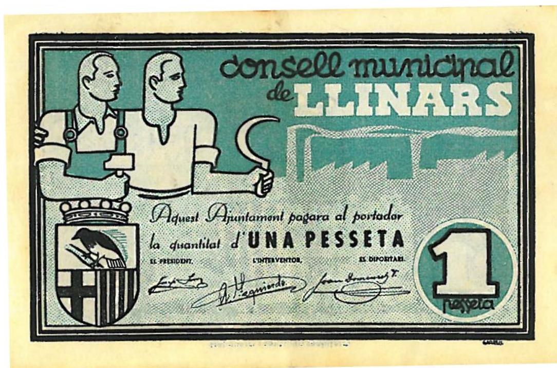
Arxiu Municipal de Llinars del Vallès. 1937. Bitllet d'1 pesseta