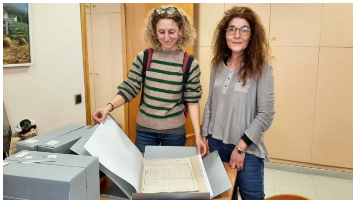
Documentació restaurada de l'Arxiu Municipal de Fogars de Montclús

Es tracta de documentació de finals del segle XIX i mitjans del segle XX