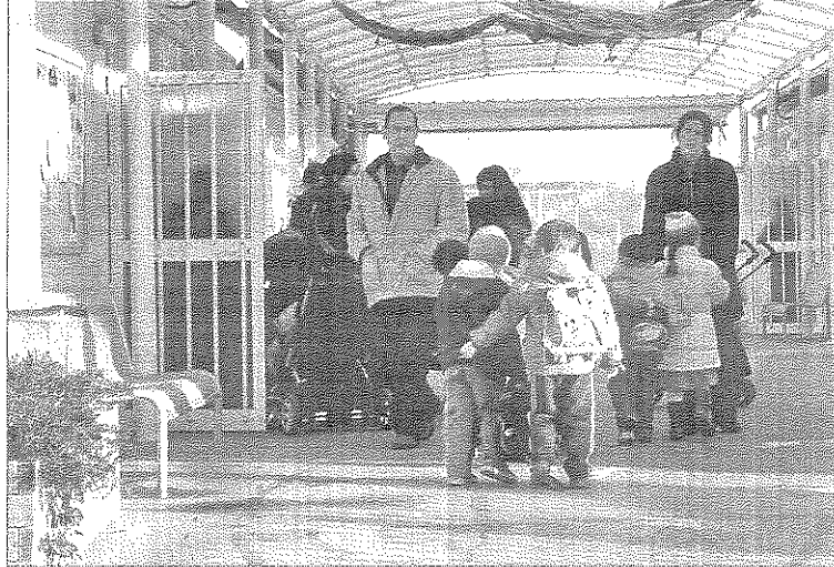
L'escola Quatre Vents està en mòduls des que es va crear l'any 2006. Els pares reclamen que s'agiliti el nou edifici

La redacció del projecte preveu fer un estudi de seguretat i salut, estudi topogràfic, geotècnic i projecte d'activitats per a la llicència ambiental de les obres. Un cop s'hagi realitzat el projec-