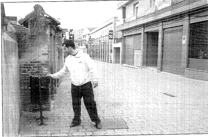
El projecte vol valorar l'impacte ambiental de les bosses utilitzades en la recollida

L'Associació de Municipis Catalans per a la Recollida Selectiva Porta a Porta és una associació sense ànim de lucre i completament independent que té per objectiu promoure i informar del model 'Porta a porta' de recollida de residus. Aquest any, l'associació està