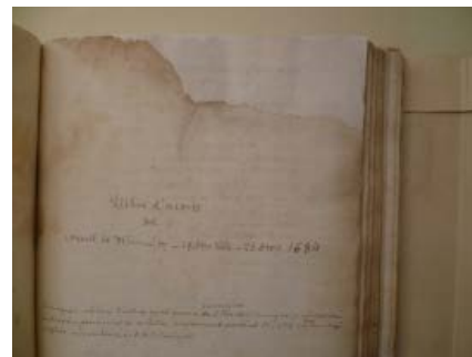
Restauració del llibre d'acords municipals Sant Pere de Vilamajor (1654-1684)

És important destacar que amb aquesta restauració es tanca el cicle de preservació i conservació iniciat amb el Programa de digitalització (inclòs en el Programa de Manteniment de la Xarxa d'Arxius Municipals) de 2009 en que es van digitalitzar les Actes del Ple i que actualment està a disposició en línia en aquest enllaç de la pàgina web de l'Ajuntament on diu actes del Ple digitalitzades, o en aquest enllaç directe de la Diputació de Barcelona http://www.diba.cat/amd/