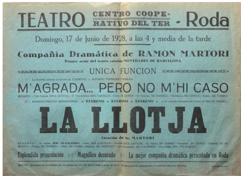
Cartell de La Llotja, Roda de Ter, 1928.

I no, no volem dir a la nostra modesta revista digital. Ens referim a l'hiperespai. O, com a mínim, una petita part d'aquesta memòria, gràcies a iniciatives com ara la mostra digital Papers de Teatre ( https://www.diba.cat/es/web/papers-de-teatre/tema ). Aquesta és la sisena exposició virtual que organitza la Xarxa d'Arxius Municipals de la Diputació de Barcelona . Programes de mà, cartells, fotografies, esbossos d'escenografies, contractes, crítiques... Tot plegat a un clic de distància. La nostra memòria (teatral) mai no havia estat tan accessible.