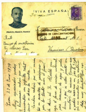
Arxiu Municipal de Vacarisses. 1939. Carta d'un presoner de guerra.

Tots els documents de l'exposició es presenten en una galeria d'imatges organitzada en set àmbits temàtics i que testimonien els profunds canvis polítics, socials, econòmics i culturals del període: Vida Republicana; Símbols i propaganda; Campanyes, ajuts i subsidis; Conseqüències de