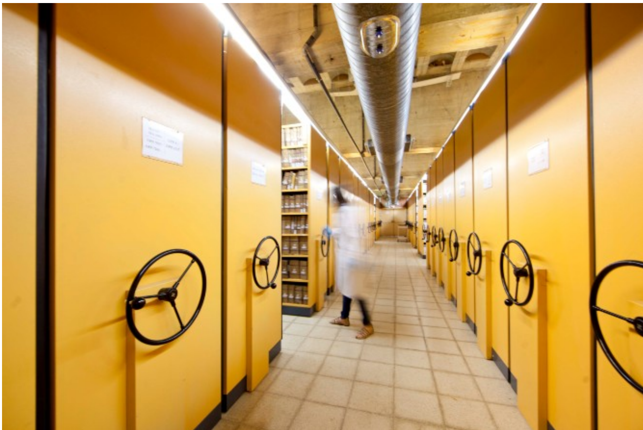
Arxiu General de la Diputació de Barcelona

El 9 de juny se celebra el Dia Internacional dels Arxius, coincidint amb la data de la fundació del Consell Internacional d'Arxius, l'any 1948. Al voltant d'aquesta efemèride té lloc la Setmana Internacional dels Arxius del 8 al 14 de juny, amb el lema Potenciar la societat del coneixement , i que, a causa de la crisi sanitària que travessa el món, enguany programa totes les seves activitats en línia.