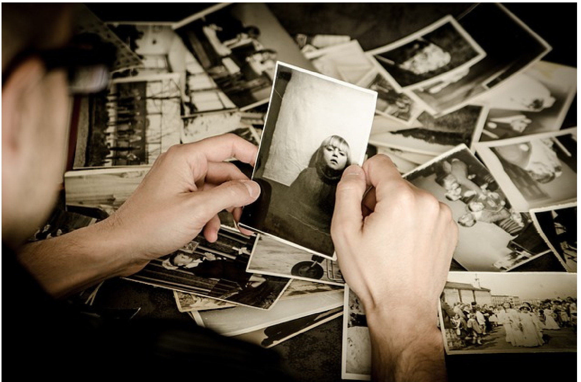
Catalunya ja compta amb més de 50 milions de fotografies identificades amb el cens dels arxius

Amb l'impuls del Departament de Cultura, els arxius catalans es preparen per commemorar la seva diada amb un seguit d'activitats ben diverses. El Dia Internacional dels Arxius és promogut pel Consell Internacional d'Arxius (CIA/ICA) de la UNESCO des del 2007 per commemorar la data de la seva creació el 9 de juny de 1948. La celebració d'enguany reivindica els arxius com a veritables serveis de la comunitat i posa el focus en la implicació de la ciutadania com a coproductora de la informació que aquests equipaments emmagatzemen, preserven i estudien.