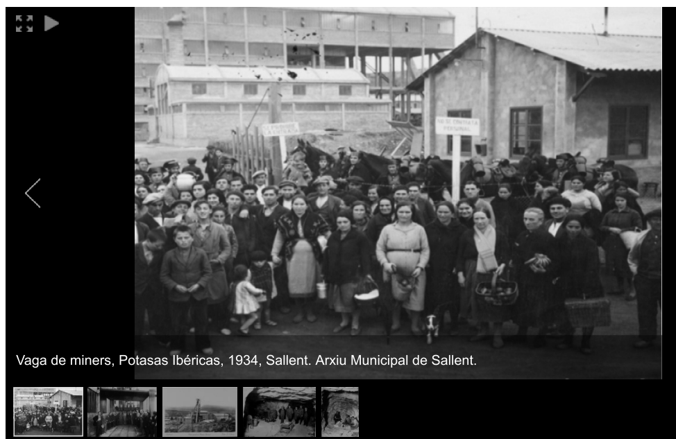
Vaga de miners, Potasas Ibéricas, 1934, Sallent. Arxiu Municipal de Sallent.