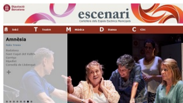
Cartellera dels espais escènics municipals