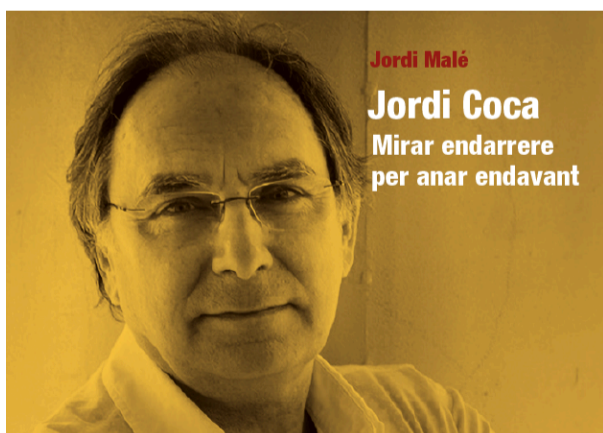
Fragment de la portada del llibre