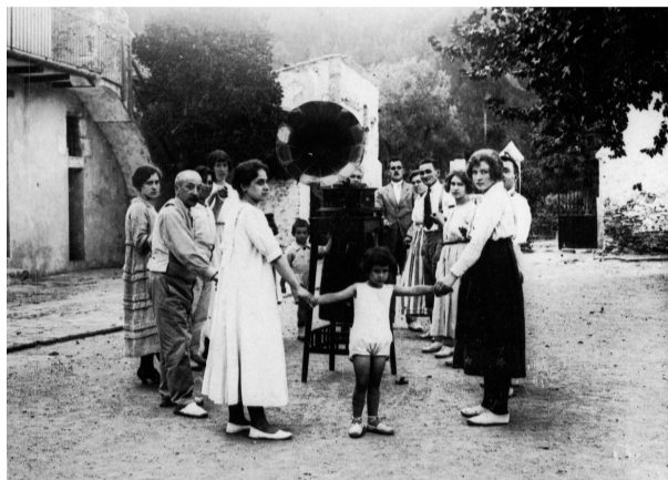
Estiuejants a la Floresta.