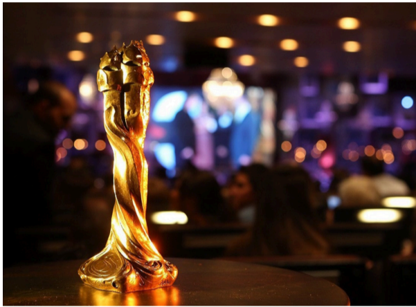
Estatueta dels Premis Gaudí

El cinema català celebra aquest dissabte, 18 de gener, la seva gran nit amb la dissetena edició dels Premis Gaudí, els guardons que atorga l'Acadèmia del Cinema Català, amb un gala al CCIB del Fòrum de Barcelona, emesa per TV3 i Catalunya Ràdio, a partir de les 22 h, amb el suport de la Diputació de Barcelona.