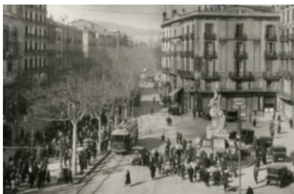
Imatge d'època de La Rambla