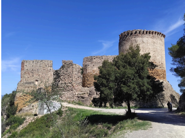
Castell de Gelida

Durant el 2024, l'Oficina de Patrimoni Cultural de l'Àrea de Cultura de la Diputació de Barcelona ha realitzat vuit nous Mapes de Patrimoni, que corresponen als municipis de Lliçà d'Amunt, Cervelló, Tona, Gelida, Calella, Sant Fost de Campsentelles, Pineda de Mar i Montmeló.