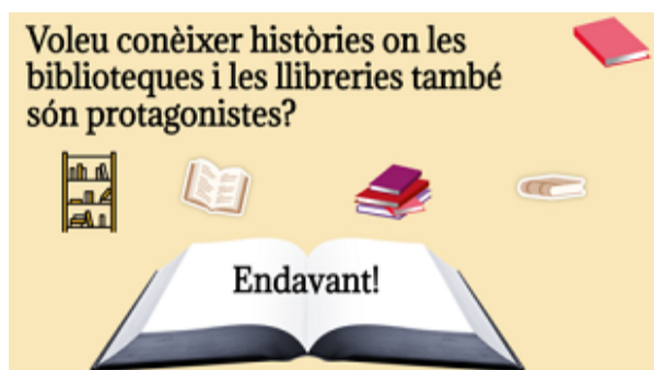
Guia Biblioteques i llibreries protagonistes