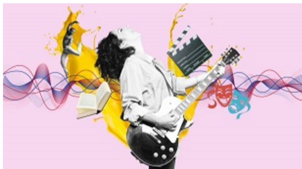
Projectes de cooperació cultural europea 2025