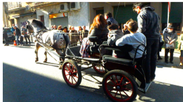
Festa de Sant Antoni Abat a Sant Feliu de Codines