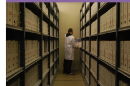
Gestió dels documents de l'Ajuntament de Castellbisbal