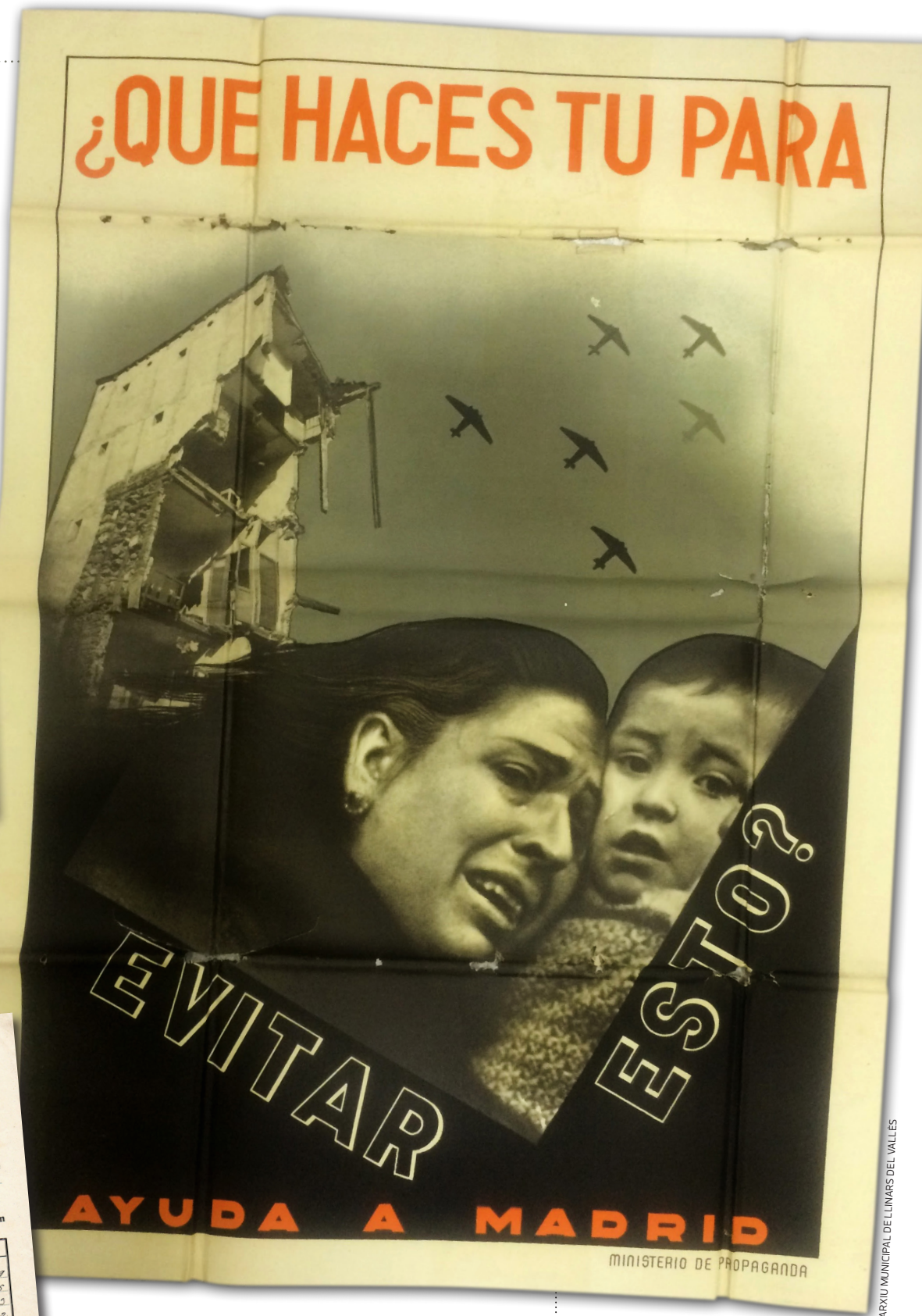
ARXIU MUNICIPAL DE LLINARS DEL VALLES

Finalment, a l'apartat Documentació complementària s'aporten cartells, targetes i un vídeo on es recull el testimoni de persones molt properes als refugiats que ens relaten les seves vivències i que ens submergeixen en aquell context d'extrema duresa que va marcar la vida de milers i milers de persones.