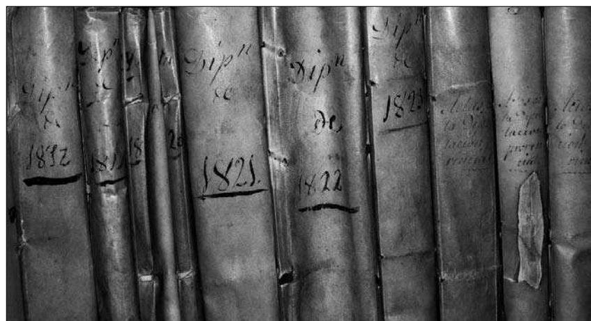
ACTES L'Arxiu Municipal d'Avià ha digitalitzat les actes des del 1863

Dins del programa de suport al patrimoni documental municipal que porta a terme l'OPC, s'han desenvolupat les eines necessàries per poder organitzar i classificar la documentació municipal. Entre aquestes, s'ha desenvolupat una base de dades i un quadre de classificació que reflecteix l'estructura i les funcions dels ens municipals. El quadre està dividit en tretze grans seccions on s'ubica la documentació en funció de la se-